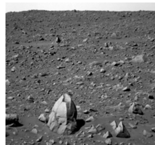
Panorama Marsa Slika 15.1

Iščem torej dejavnike ter zakonitosti, ki ustvarjajo na Zemlji opaženo bogato estetiko in izraznost flore in favne.